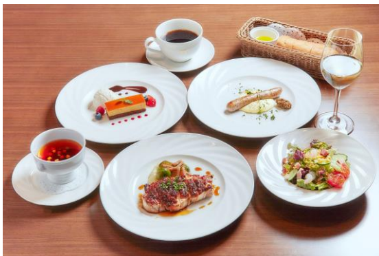
※万華響特別ランチコース