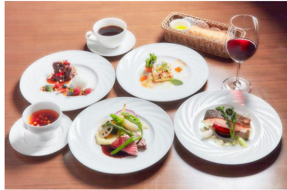
※万華響特別ディナーコース